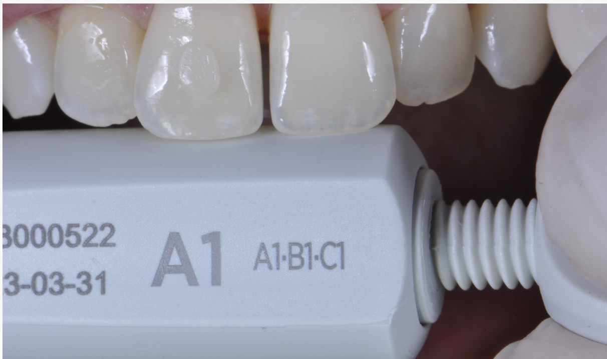
Imagem 4: teste de cor com resina Neo Spectra A1 no dente 11.

5. Realize o teste de cor para verificar se a cor escolhida está compatível com o substrato dentário. O teste é realizado colocando um incremento de resina (sem realizar procedimento adesivo) na região a ser restaurada e realizando a fotopolimerização do incremento durante pelo menos 20 segundos com um fotopolimerizador de alta irradiância. Depois de fotopolimerizado jogue água sobre a resina e verifique a compatibilidade da tonalidade. Uma vez que a cor seja compatível remova o incremento de resina com uma espátula fazendo um movimento lateral na interface de união.