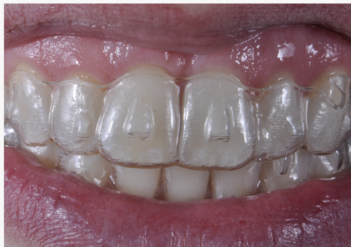
Imagem 26: Sorriso com o aparelho em posição.