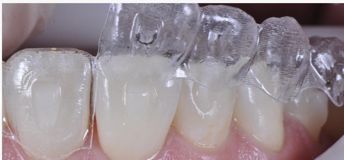
Imagem 20: Remoção do gabarito

16- Remova o gabarito e com auxílio de pontas multilaminadas remova os excessos superficiais e dê acabamento com Pontas de acabamento ENHANCE®