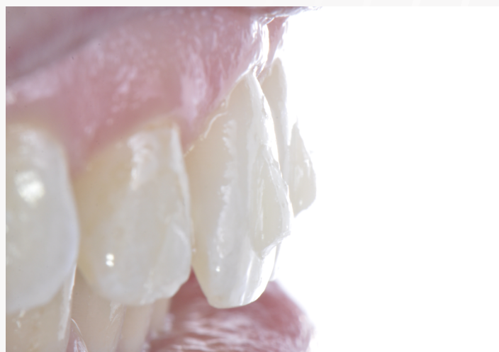
Imagem 24: Aspecto por visão lateral dos attachments cimentados.