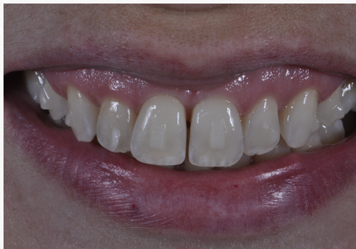
Imagem 25: Sorriso com os attachments