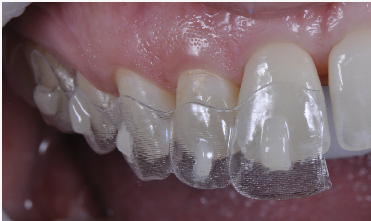
Imagem 17: Posicionamento do gabarito

14. Leve o gabarito com a resina aplicada em posição, segurando firmemente contra a arcada e verificando o encaixe completo na área incisal.