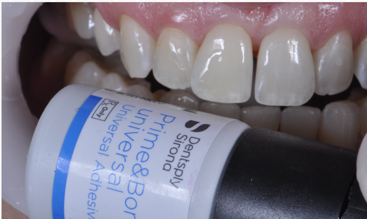
Imagem 15: Aspecto do esmalte condicionado com Prime & Bond Universal