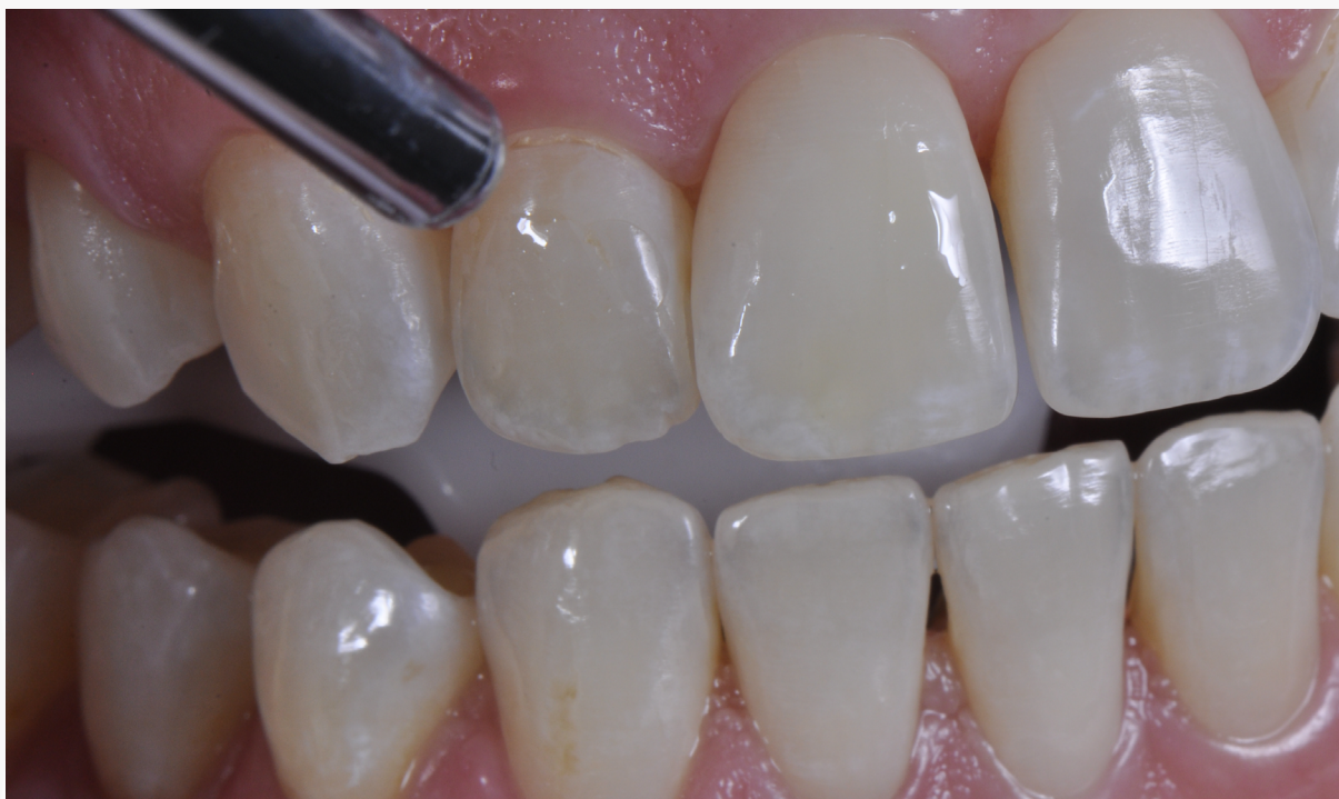
Imagem 16: Evaporação do solvente com jato de ar.