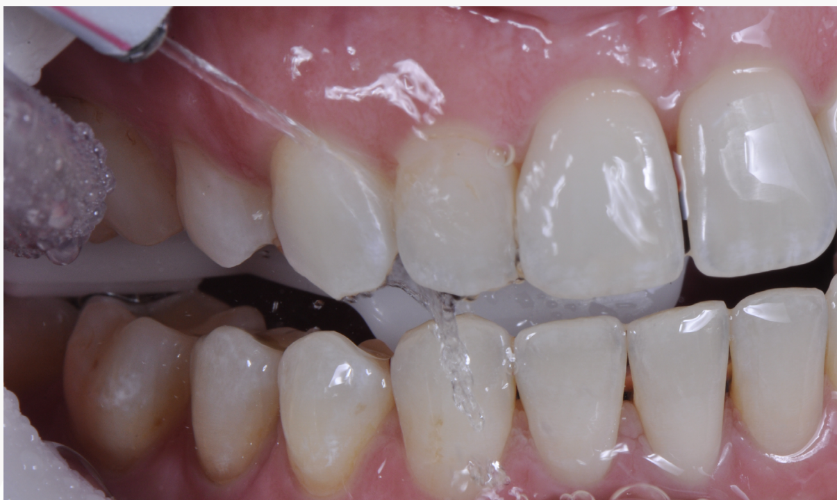
Imagem 12: Lavagem abundante de toda a área condicionada

10. Lave abundantemente para que a superfície seja totalmente limpa do ácido