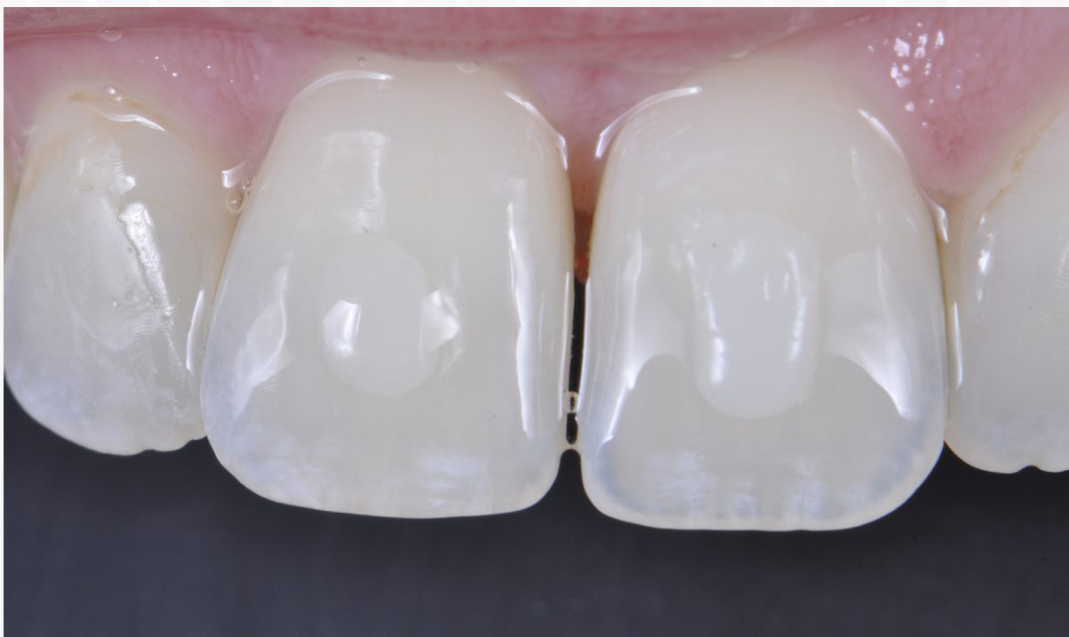
Imagem 6: Escolha da compatibilidade com o dente e resina úmidos.

6. Corte o gabarito em duas partes na região da linha média. Isso facilita o processo de adesão por quadrante e diminui o risco da contaminação da área adesiva.