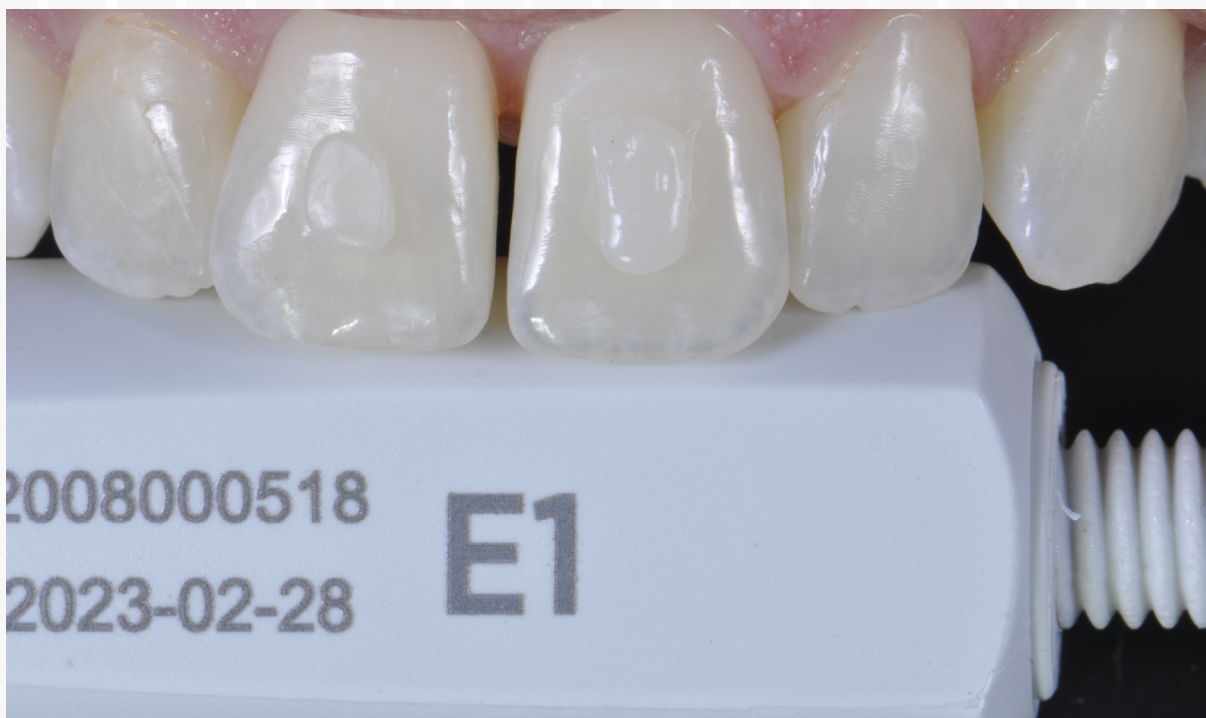
Imagem 5: Teste de cor utilizando a resina Neo Spectra E1 no dente 21.