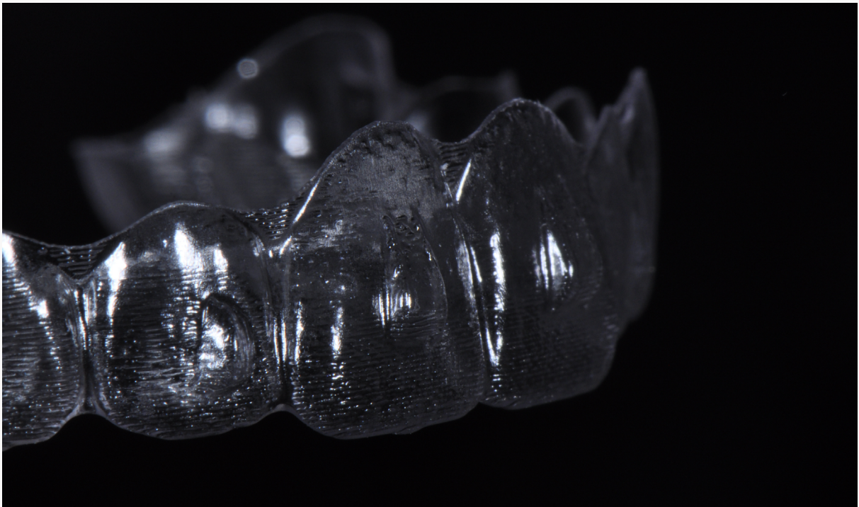
Imagem 1: gabarito para construção dos attachments