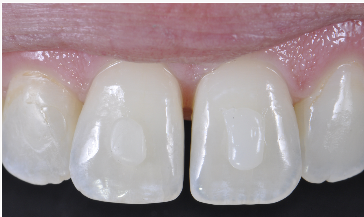
Imagem 6: Aspecto das resinas após a fotopolimerização