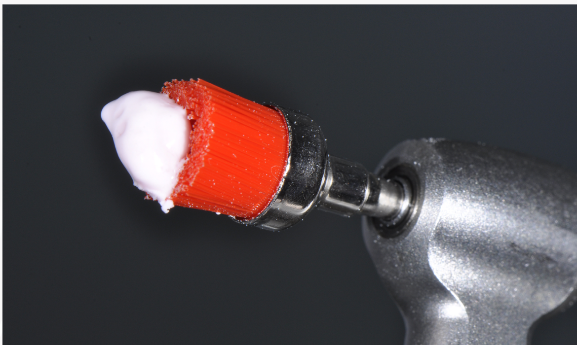
Imagem 3: Pasta para profilaxia dos dentes

3. Remova o gabarito da boca do paciente, realize raspagem e profilaxia com Pasta Profilática Odahcan® para remoção de cálculo e biofilme que possa prejudicar a adesão.