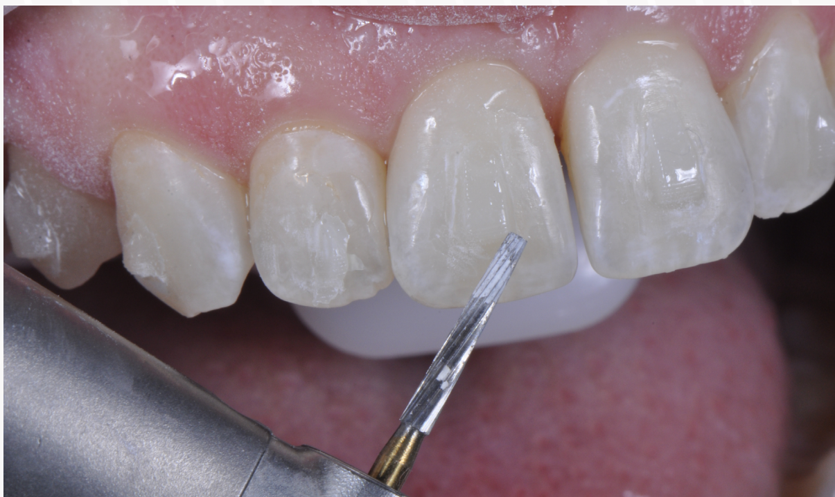
Imagem 21: remoção dos excessos com ponta multilaminada e contra-ângulo multiplicador 1:5