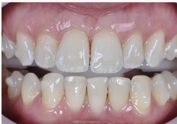
Imagem 23: Aspecto dos dentes após a cimentação dos attachments

18. Repita os processos nos quadrantes seguintes