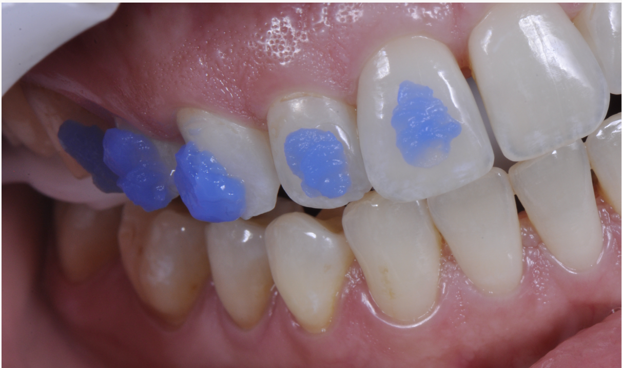
Imagem 10: condicionamento de hemi arcada das áreas a serem cimentadas com ácido fosfórico.

8. Realize o processo de condicionamento das áreas onde serão colados os attachments utilizando Ácido Fosfórico 37% Dentsply®. Tente realizar o condicionamento em uma área um pouco maior que o tamanho do attachment mas evite o condicionamento de áreas desnecessárias. Tome o cuidado de recolher o ácido antes de realizar a lavagem para diminuir a quantidade de ácido que pode cair na cavidade bucal causando desconforto ao paciente.