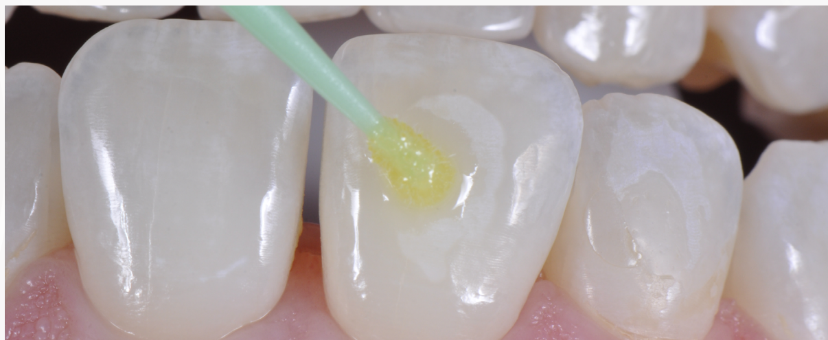
Imagem 14: Aplicação do adesivo sobre a área condicionada