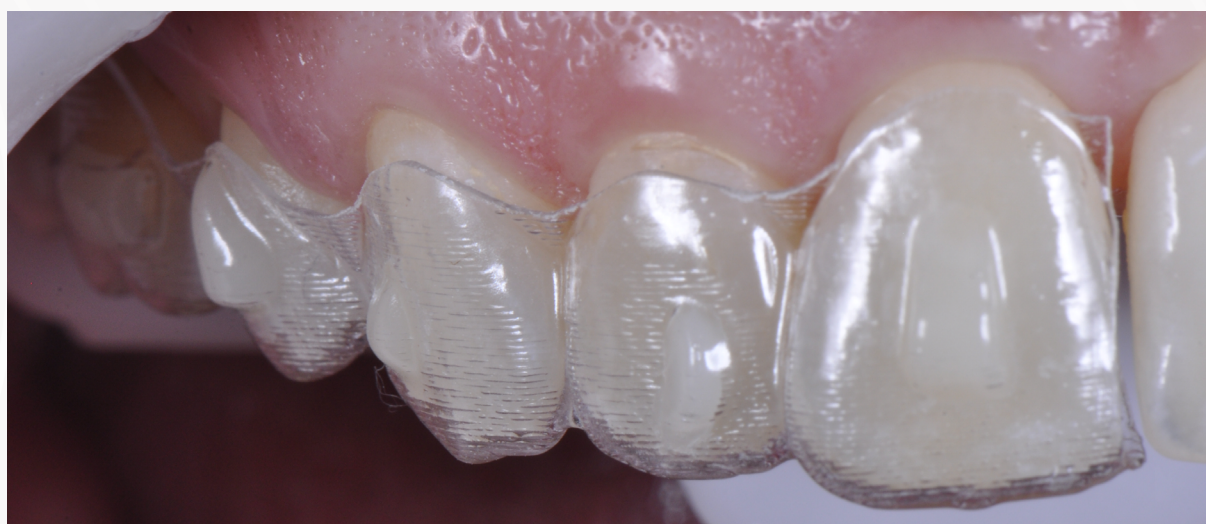
Imagem 18: Conferência do posicionamento do gabarito pela incisal