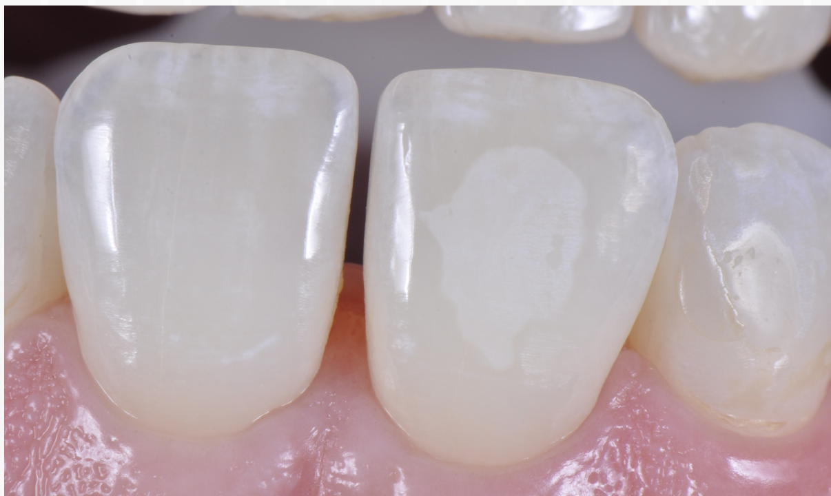
Imagem 13: Aspecto do esmalte condicionado após a secagem