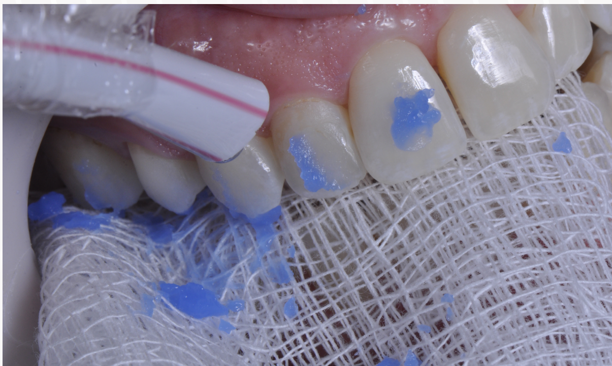
Imagem 11: Remoção dos excessos de ácido fosfórico e recolhimento sobre a gaze para que não caia na cavidade bucal irritando as mucosas ou causando desconforto ao paciente.

10. Lave abundantemente para que a superfície seja totalmente limpa do ácido