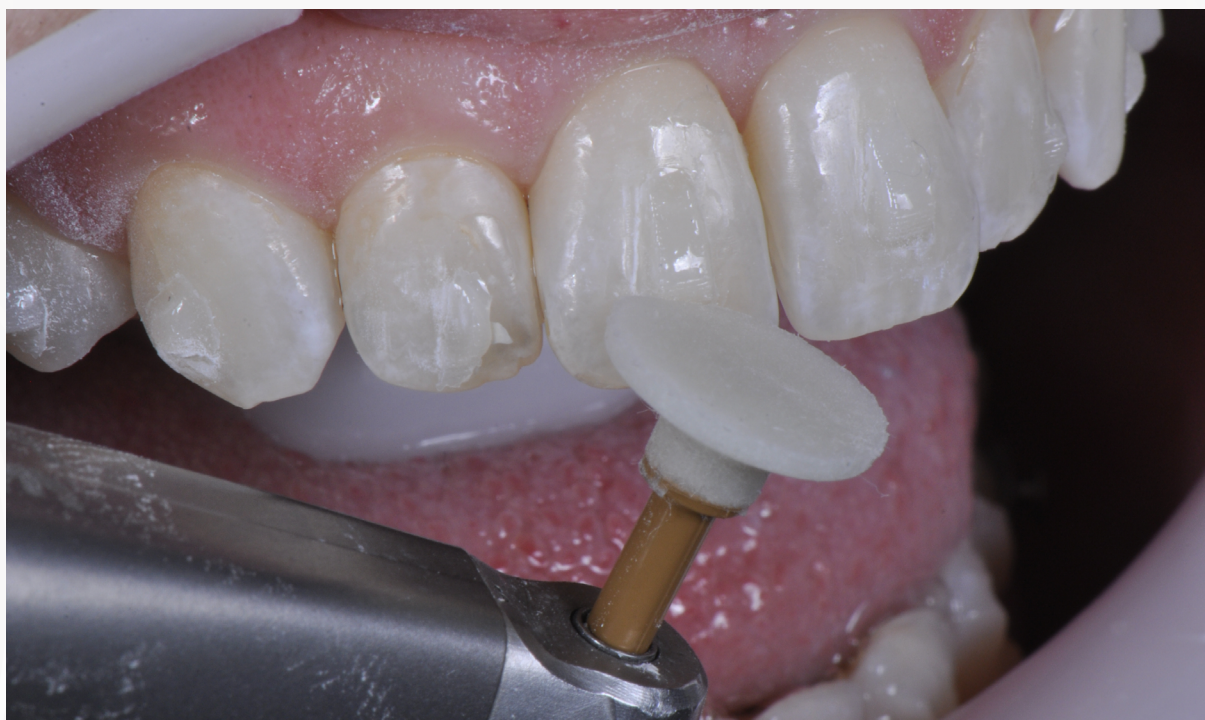
Imagem 22: Acabamento com enhance e contra ângulo 1:1 sirona