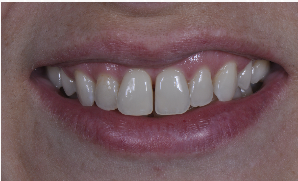
Imagem 2: Aspecto inicial da paciente

3. Remova o gabarito da boca do paciente, realize raspagem e profilaxia com Pasta Profilática Odahcan® para remoção de cálculo e biofilme que possa prejudicar a adesão.